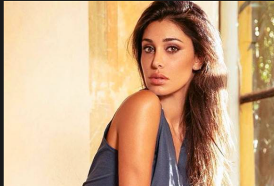
Belen Rodriguez pubblica un pigiama stupendo

Belen Rodriguez ha messo fine alla storia con Andrea Iannone. Eppure, nelle ultime ore si è verificato un episodio che ci spiazza completamente.